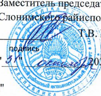
График ГУК "Слонимский районный центр культуры"

киновидеообслуживания сельского населения передвижной установкой на ноябрь 2024г