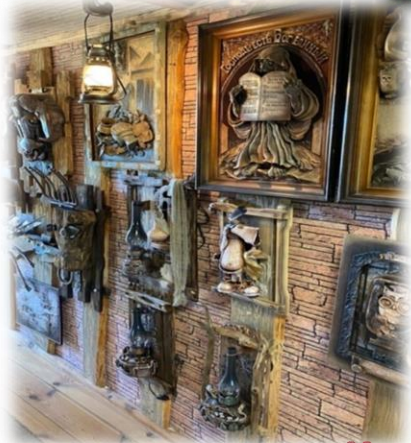
Дом-музей «Сказка наяву»