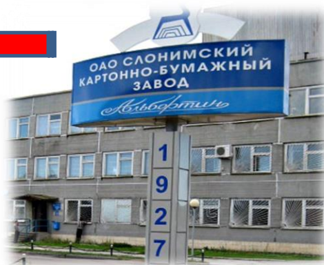
ОАО СКБЗ «Альбертин»